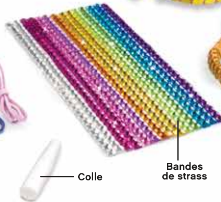
Bandes de strass