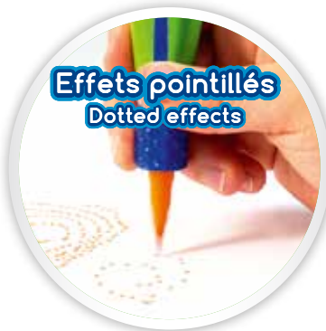
Effets pointillés Dotted effects

Depending on how you hold your Pixelo, you will achieve different effects: