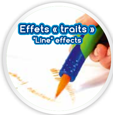
Effets « traits » "Line" effects